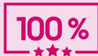
Norme transversale Télesanté

Un merci tout spécial aux employés, aux gestionnaires, aux bénévoles et aux membres du conseil d'administration pour leur contribution à l'atteinte de ces remarquables résultats!