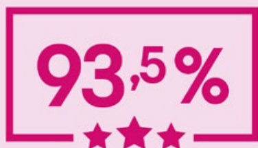
Services de santé physique

Voici les notes qui ont été décernées pour chacun des trois volets évalués :