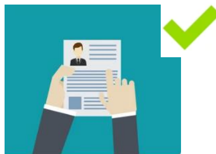
Mêmes informations que sur le formulaire