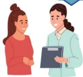
Date de naissance